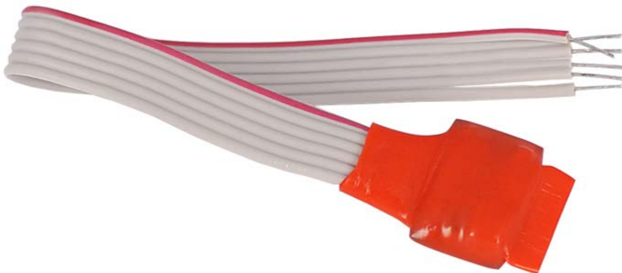
Рисунок 2.2.1 Внешний вид АР1

На рисунке 2.2.1 представлены внешний вид АР1.