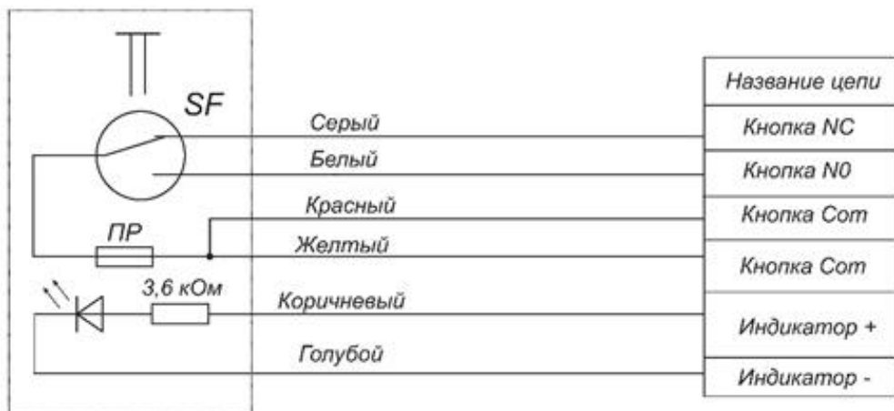
Рисунок 2 – Маркировка выводов изделия AL-BT-S03