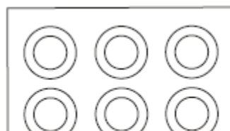
Чёрный СОМ Красный 6 Вт Белый 3 Вт

При подключении громкоговорителей к линии, один провод подключается к клемме СОМ (с чёрным проводом), а второй провод к клемме требуемой мощности. Клемма с красным проводом для номинальной мощности (6 Вт), с белым для 1/2 мощности (3 Вт).