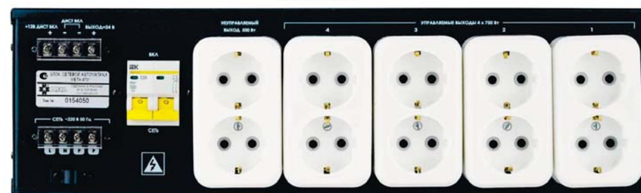
Рисунок 1. Внешний вид БСА.

2.14 На лицевой панели БСА расположены следующие индикаторы и органы управления: