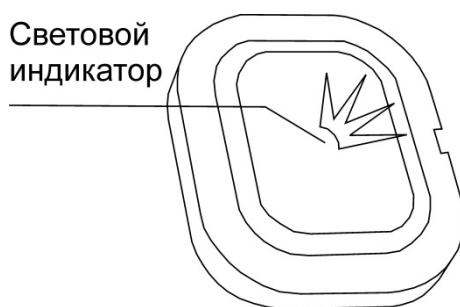
Рисунок 2.1 Внешний вид

В верхней части лицевой панели находятся паз для открывания корпуса при помощи отвёртки с плоским наконечником.