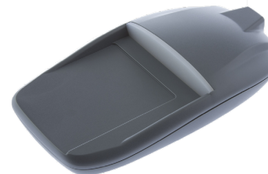
Рисунок 1. Внешний вид считывателя PR-X18

Внешний вид считывателей представлен на рисунке 1.