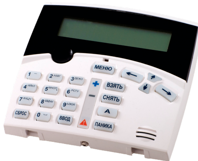
Рисунок 1. Выносная клавиатура AKD-01

Внешний вид клавиатуры представлен на рисунке 1.