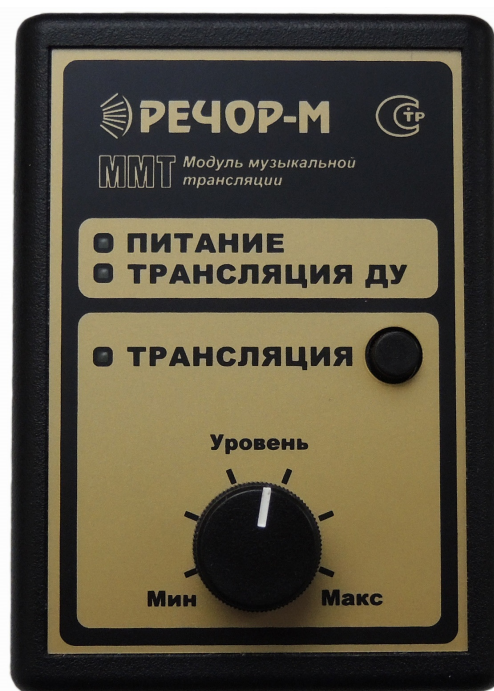
Рис. 1 Общий вид модуля ММТ

Для установки номинального уровня симметричного сигнала на выходе модуля может быть использован встроенный регулятор УРОВЕНЬ.