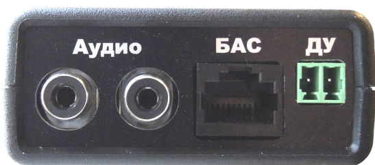
Рис. 2 Вид коммутационной панели модуля ММТ

На коммутационной панели модуля (см. Рис. 2) размещены следующие разъемы: